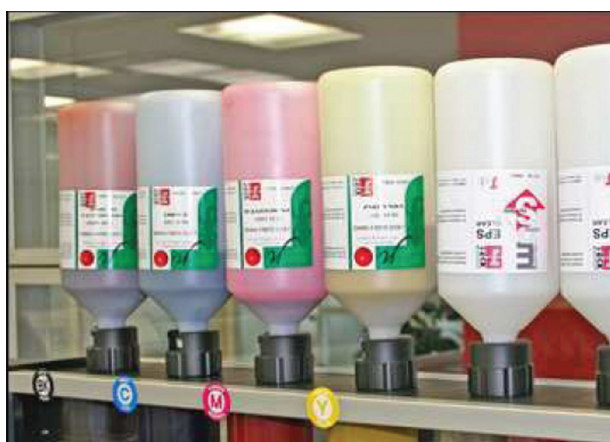
Slika 2: EPS Clear (dve boce sa desne strane)

12 -tog i 13-tog maja, organizovane pod pokroviteljstvom J-Teck kompanije.