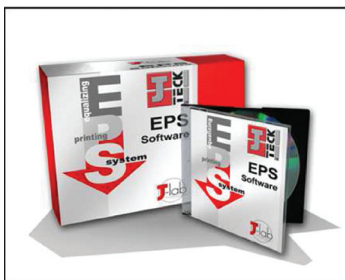
Slika 1: Softver koji sve planira

Tri dana puna posla, interesantnih susreta i novih projekata! Tako se ukratko može opisati pojava J-Teck-a na sajmu FESPA Digital 2009 u Amsterdamu! Ovaj sajam postao je glavni događaj u Evropi, pre svega na tržištu digitalnih štamparskih usluga. Više nego ikad, J-Teck je nastupio sa statusom jedne od vodećih svetskih kompanija u proizvodnji boja za digitalnu štampu na bazi vode, za tržište grafike i tekstila. Kao i do sada, J-Teck-ov štand bio je prepun prijatelja i saradnika, kao i moćnih klijenata, koji su želeli da što više upoznaju J-Teck-ove proizvode i projekte.